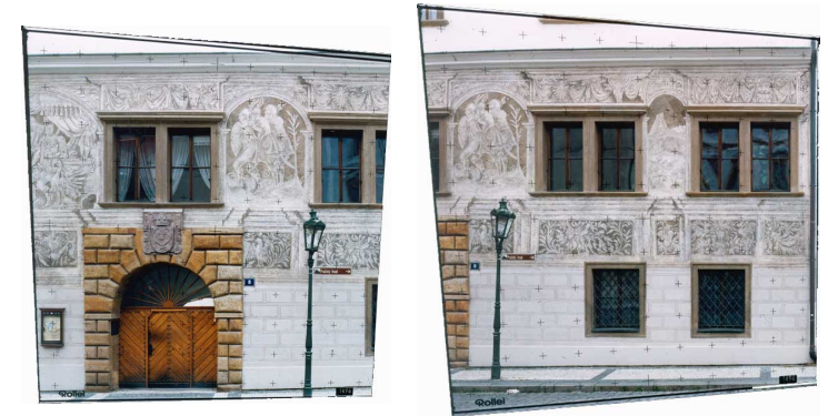
2) dvojice snímků po transformaci ( transformace )