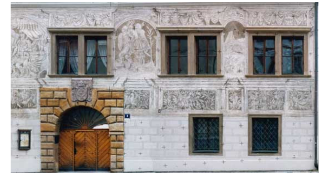
4) snímky byly spojeny a oříznuty v jeden fotoplán ( mozaikování )