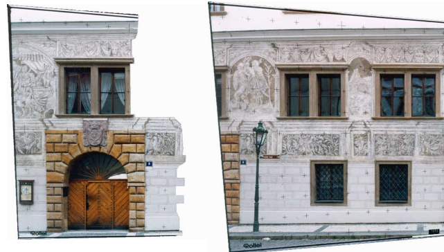
3) levý snímek byl omaskován ( maskování )